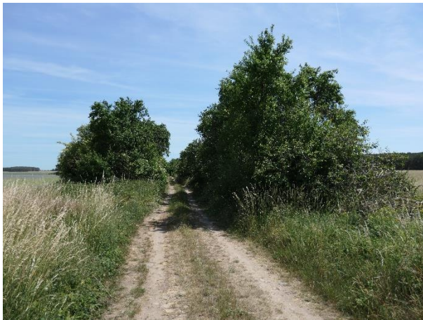
Abb. 3: Gehölzstrukturen im Untersuchungsgebiet