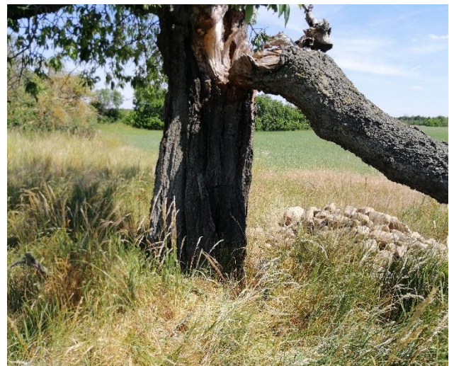
Abb. 6: Lesesteinhaufen im LR