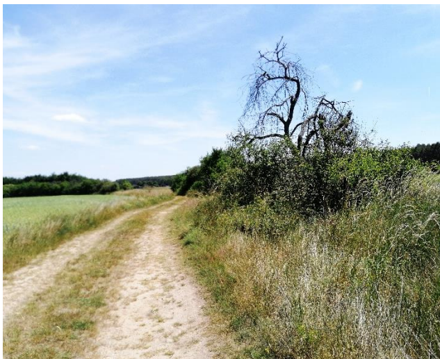
Abb. 5: LR im nördlichen UG

Der ermittelte LR verläuft entlang der nördlichen Grenze des PG an einem Feldweg mit begleitenden Saumstreifen. Das Habitat bietet eine heterogene Vegetationsstruktur mit Sträuchern, Bäumen und hochwüchsigen Gräsern sowie offene Bereiche in sonnenexponierter Lage (Abb. 5). Weitere Habitatrequisiten wie Findlinge und Steinhäufen bieten geeignete Sonnenplätze und Verstecke (Abb. 6).