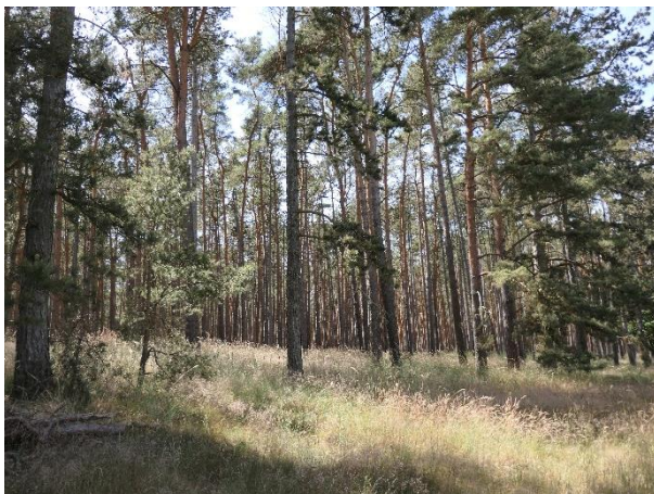
Abb. 4: Kiefernforst im südlichen Untersuchungsgebiet