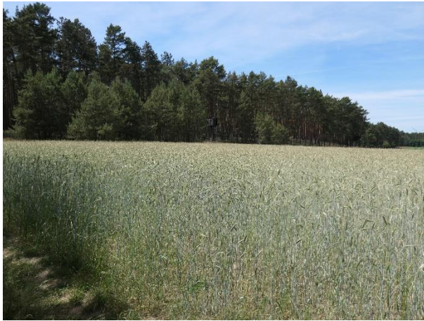
Abb. 2: Offenlandbereiche im Untersuchungsgebiet